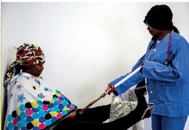
© Fatoumata Diabaté © L'atelier des femmes fortes

On fouille dans l'intimité De mon histoire et de mon corps SANS ME DEMANDER